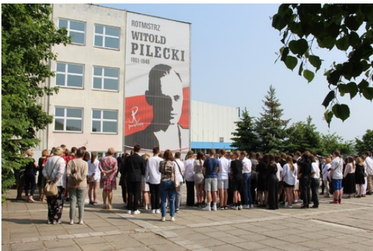
Uroczystości poświęcone Witoldowi Pileckiemu, fot. SP 21.

26 maja 2023 r., w związku z 75. rocznicą śmierci rotmistrza Witolda Pileckiego odbyły się uroczystości w Grudziądzu, na których obecni byli przedstawiciele Instytutu Pamięci Narodowej.