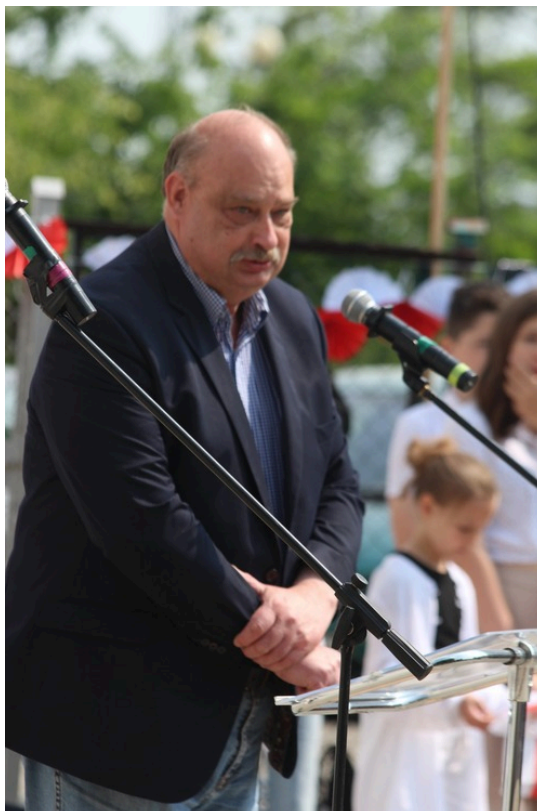
Uroczystości poświęcone Witoldowi Pileckiemu, fot. SP 21.