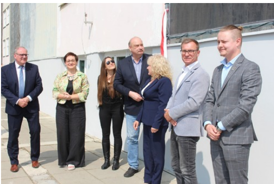
Uroczystości poświęcone Witoldowi Pileckiemu, fot. SP 21.