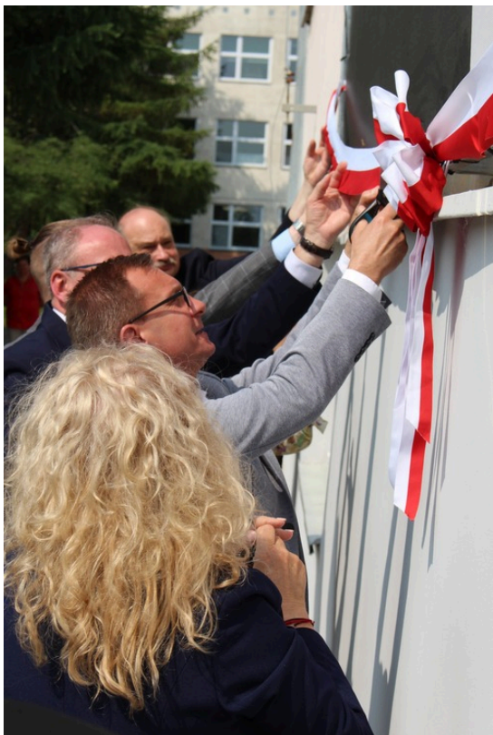
Uroczystości poświęcone Witoldowi Pileckiemu, fot. SP 21.