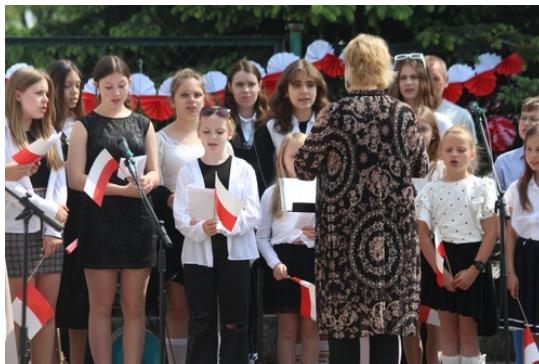
Uroczystości poświęcone Witoldowi Pileckiemu, fot. SP 21.