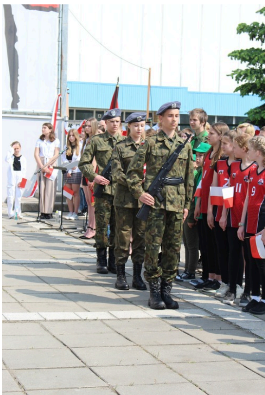
Uroczystości poświęcone Witoldowi Pileckiemu, fot. SP 21.

W oficjalnych uroczystościach udział wzięli przedstawiciele władz miasta i kuratorium