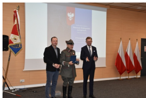
Konferencja naukowa „Powstanie Wielkopolskie na Kujawach. Historia i pamięć”