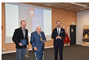
Konferencja naukowa „Powstanie Wielkopolskie na Kujawach. Historia i pamięć”