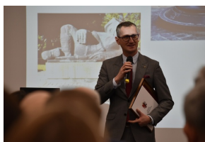
Konferencja naukowa „Powstanie Wielkopolskie na Kujawach. Historia i pamięć”