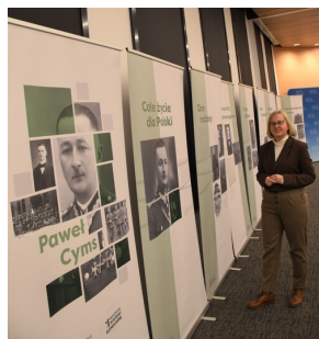
Konferencja naukowa „Powstanie Wielkopolskie na Kujawach. Historia i pamięć”