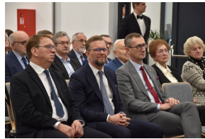
Konferencja naukowa „Powstanie Wielkopolskie na Kujawach. Historia i pamięć”