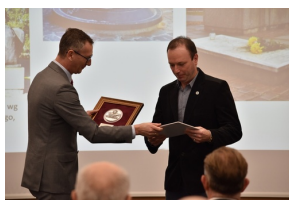
Konferencja naukowa „Powstanie Wielkopolskie na Kujawach. Historia i pamięć”