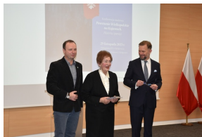
Konferencja naukowa „Powstanie Wielkopolskie na Kujawach. Historia i pamięć”