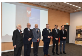
Konferencja naukowa „Powstanie Wielkopolskie na Kujawach. Historia i pamięć”