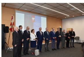
Konferencja naukowa „Powstanie Wielkopolskie na Kujawach. Historia i pamięć”