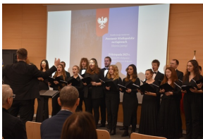
Konferencja naukowa „Powstanie Wielkopolskie na Kujawach. Historia i pamięć”

Uroczystość uświetnił koncert utworów wojskowych i patriotycznych w wykonaniu Chóru Akademickiego Uniwersytetu Kazimierza Wielkiego.