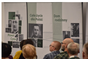
Konferencja naukowa „Powstanie Wielkopolskie na Kujawach. Historia i pamięć”