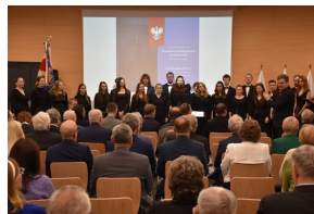
Konferencja naukowa „Powstanie Wielkopolskie na Kujawach. Historia i pamięć”