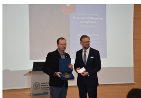
Konferencja naukowa „Powstanie Wielkopolskie na Kujawach. Historia i pamięć”