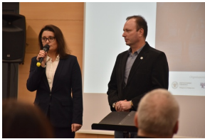
Konferencja naukowa „Powstanie Wielkopolskie na Kujawach. Historia i pamięć”