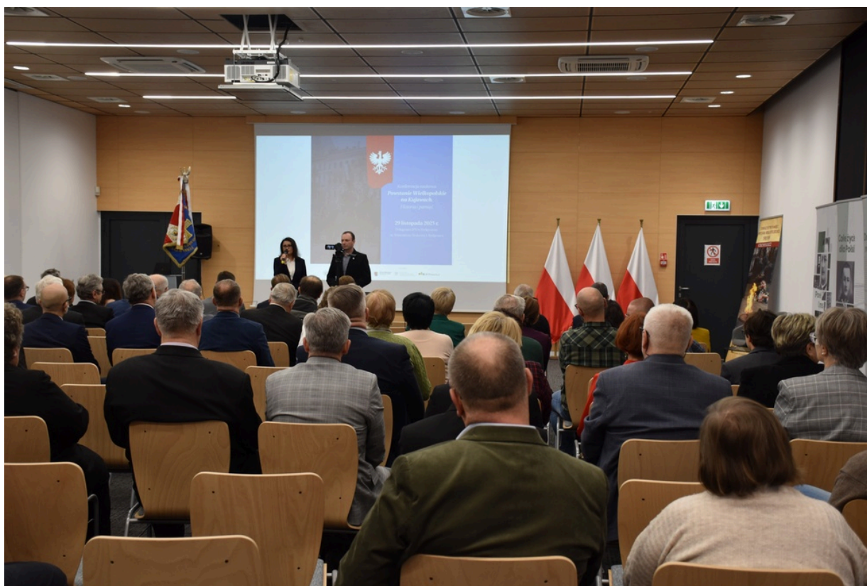
Konferencja naukowa „Powstanie Wielkopolskie na Kujawach. Historia i pamięć”

29 listopada 2023 r., w Delegaturze Instytutu Pamięci Narodowej w Bydgoszczy, odbyła się konferencja naukowa „Powstanie Wielkopolskie na Kujawach. Historia i pamięć”. Wydarzenia organizowane jest z okazji jubileuszu 25-lecia Oddziału Kujawsko-Pomorskiego Towarzystwa Pamięci Powstania Wielkopolskiego 1918-1919.