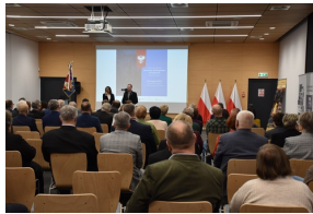
Konferencja naukowa „Powstanie Wielkopolskie na Kujawach. Historia i pamięć”

Uroczystość uświetnił koncert utworów wojskowych i patriotycznych w wykonaniu Chóru Akademickiego Uniwersytetu Kazimierza Wielkiego.