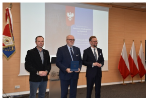
Konferencja naukowa „Powstanie Wielkopolskie na Kujawach. Historia i pamięć”