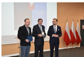
Konferencja naukowa „Powstanie Wielkopolskie na Kujawach. Historia i pamięć”