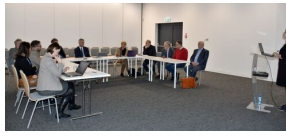
I posiedzenie komisji ds. województwa kujawsko-pomorskiego Komitetu Ochrony Pamięci Walk i Męczeństwa w Delegaturze IPN w Bydgoszczy - Bydgoszcz, 9 lutego 2024