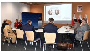
I posiedzenie komisji ds. województwa kujawsko-pomorskiego Komitetu Ochrony Pamięci Walk i Męczeństwa w Delegaturze IPN w Bydgoszczy - Bydgoszcz, 9 lutego 2024