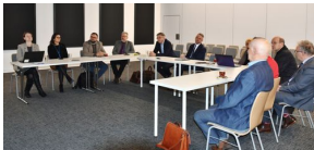
I posiedzenie komisji ds. województwa kujawsko-pomorskiego Komitetu Ochrony Pamięci Walk i Męczeństwa w Delegaturze IPN w Bydgoszczy - Bydgoszcz, 9 lutego 2024