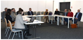
I posiedzenie komisji ds. województwa kujawsko-pomorskiego Komitetu Ochrony Pamięci Walk i Męczeństwa w Delegaturze IPN w Bydgoszczy - Bydgoszcz, 9 lutego 2024