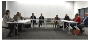
I posiedzenie komisji ds. województwa kujawsko-pomorskiego Komitetu Ochrony Pamięci Walk i Męczeństwa w Delegaturze IPN w Bydgoszczy - Bydgoszcz, 9 lutego 2024