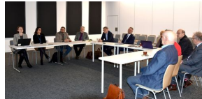
I posiedzenie komisji ds. województwa kujawsko-pomorskiego Komitetu Ochrony Pamięci Walk i Męczeństwa w Delegaturze IPN w Bydgoszczy - Bydgoszcz, 9 lutego 2024