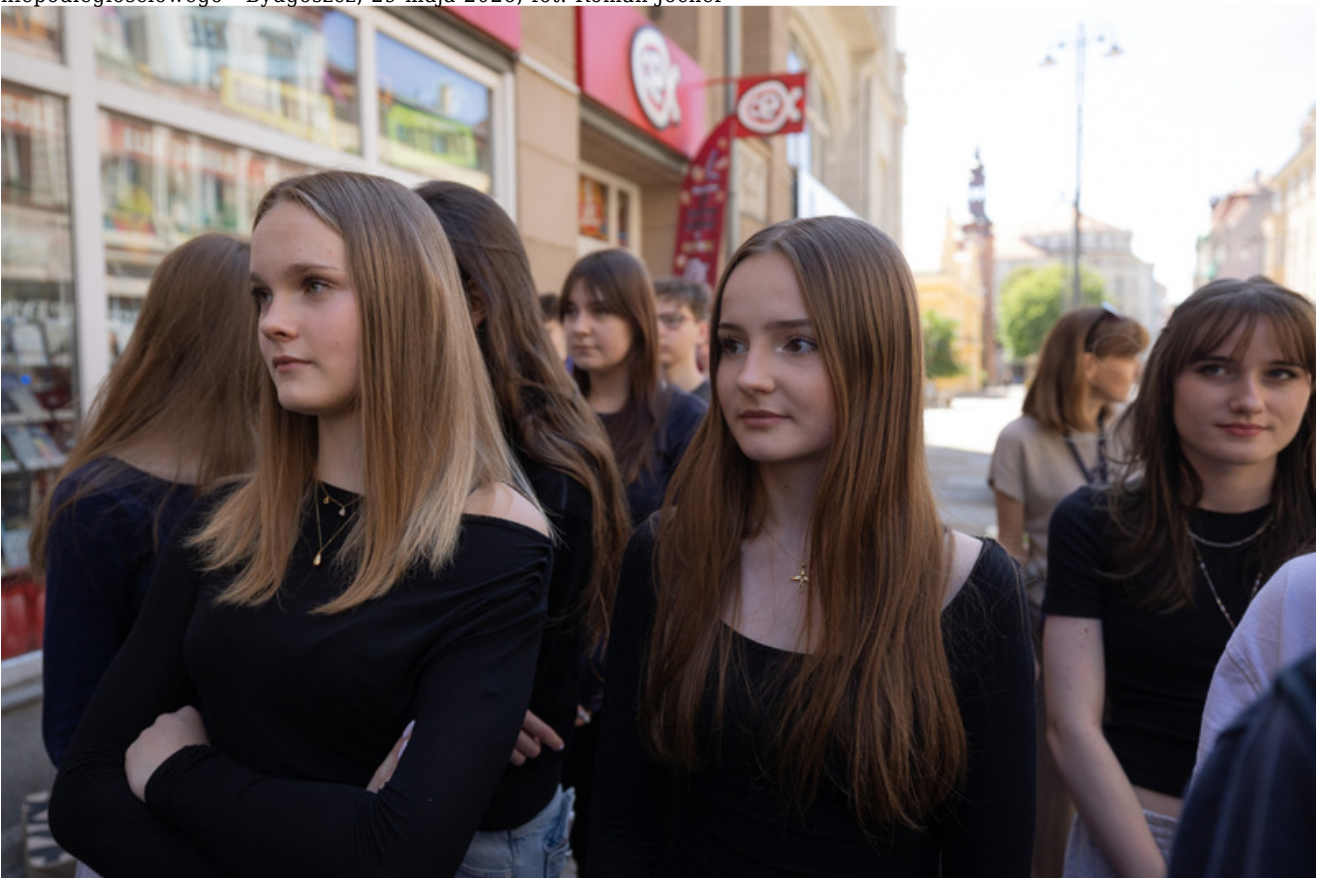
29 maja 2026 r. w Bydgoszczy odbyły się uroczystości upamiętniające 80. rocznicę śmierci Jerzego Gadzinowskiego „Szarego” oraz jego sześciu podkomendnych - żołnierzy Armii Krajowej i uczestników powojennego podziemia niepodległościowego - Bydgoszcz, 29 maja 2026