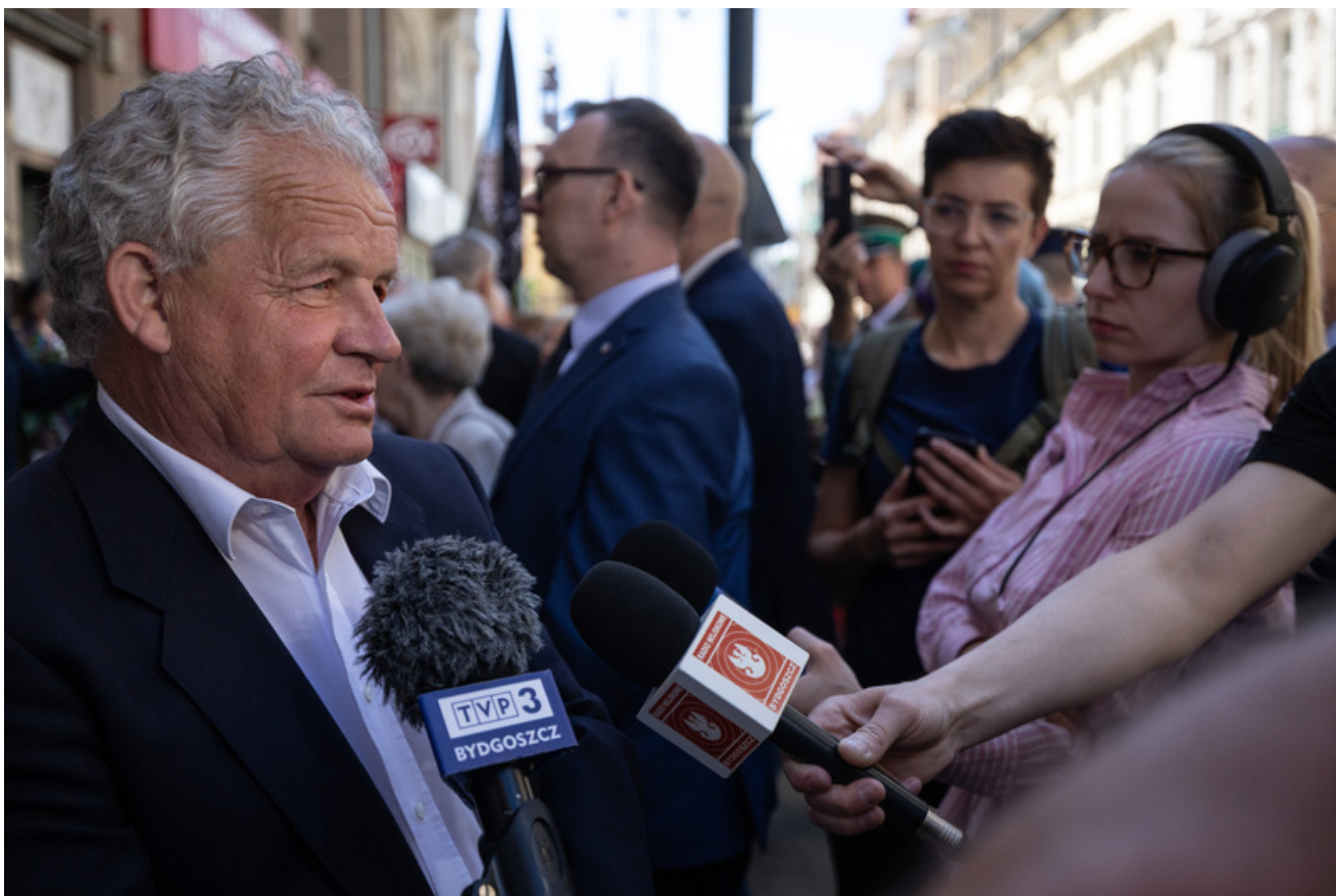
W dniu 29 maja 2026 r. w Bydgoszczy odbyły się uroczystości upamiętniające 80. rocznicę śmierci Jerzego Szarego „Szarego” oraz jego sześciu podkomendnych – żołnierzy Armii Krajowej i uczestników powojennego podziemia niepodległościowego - Bydgoszcz, 29 maja 2026