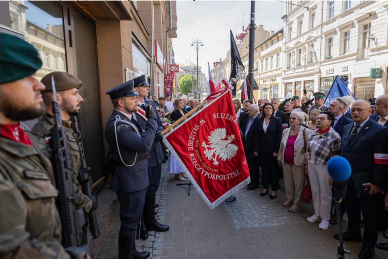
29 maja 2026 r. w Bydgoszczy odbyły się uroczystości upamiętniające 80. rocznicę śmierci Jerzego Gadzinowskiego „Szarego” oraz jego sześciu podkomendnych - żołnierzy Armii Krajowej i uczestników powojennego podziemia niepodległościowego - Bydgoszcz, 29 maja 2026, fot. Roman Jocher