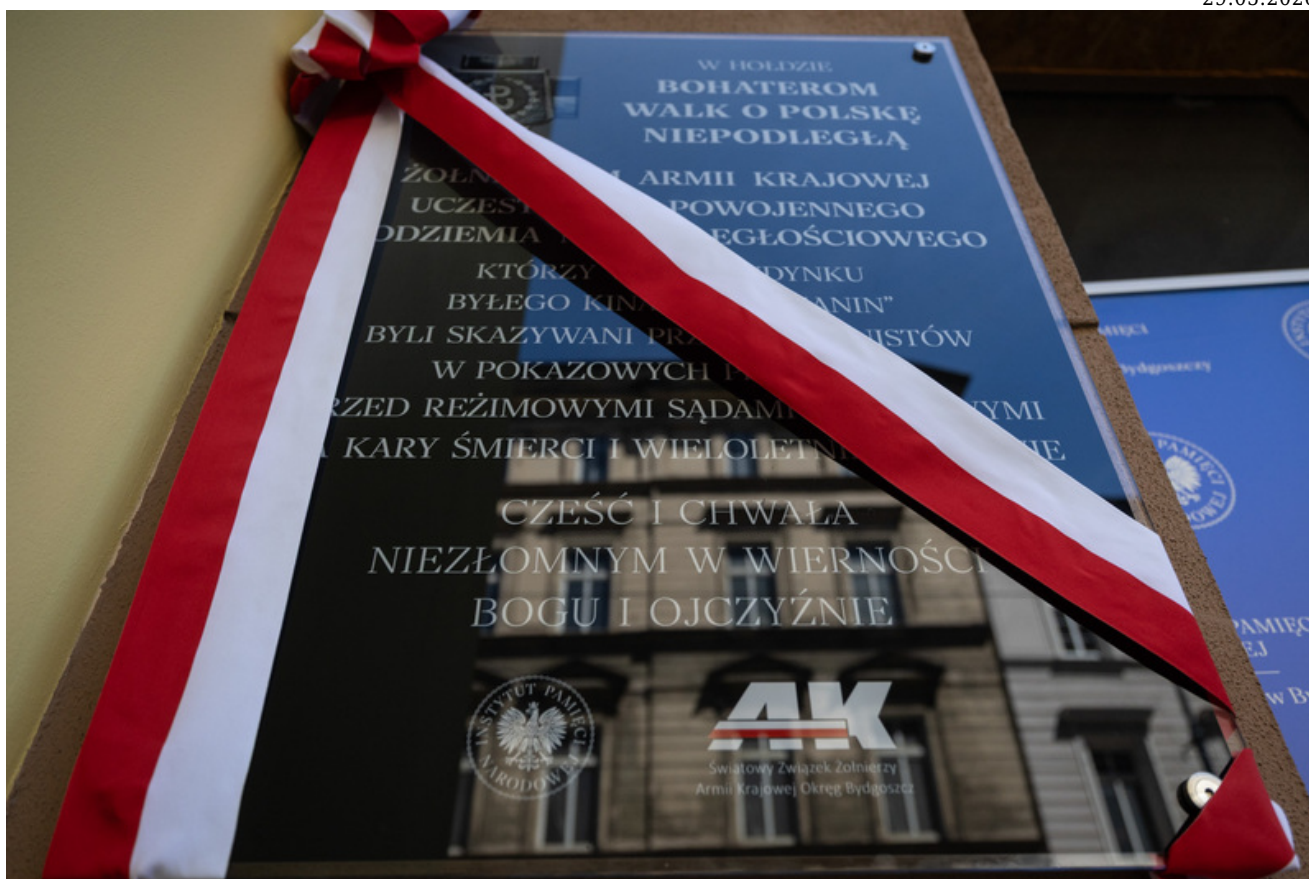
29 maja 2026 r. w Bydgoszczy odbyły się uroczystości upamiętniające 80. rocznicę śmierci Jerzego Gadzinowskiego „Szarego” oraz jego sześciu podkomendnych – żołnierzy Armii Krajowej i uczestników powojennego podziemia niepodległościowego - Bydgoszcz, 29 maja 2026, fot. Roman Joher