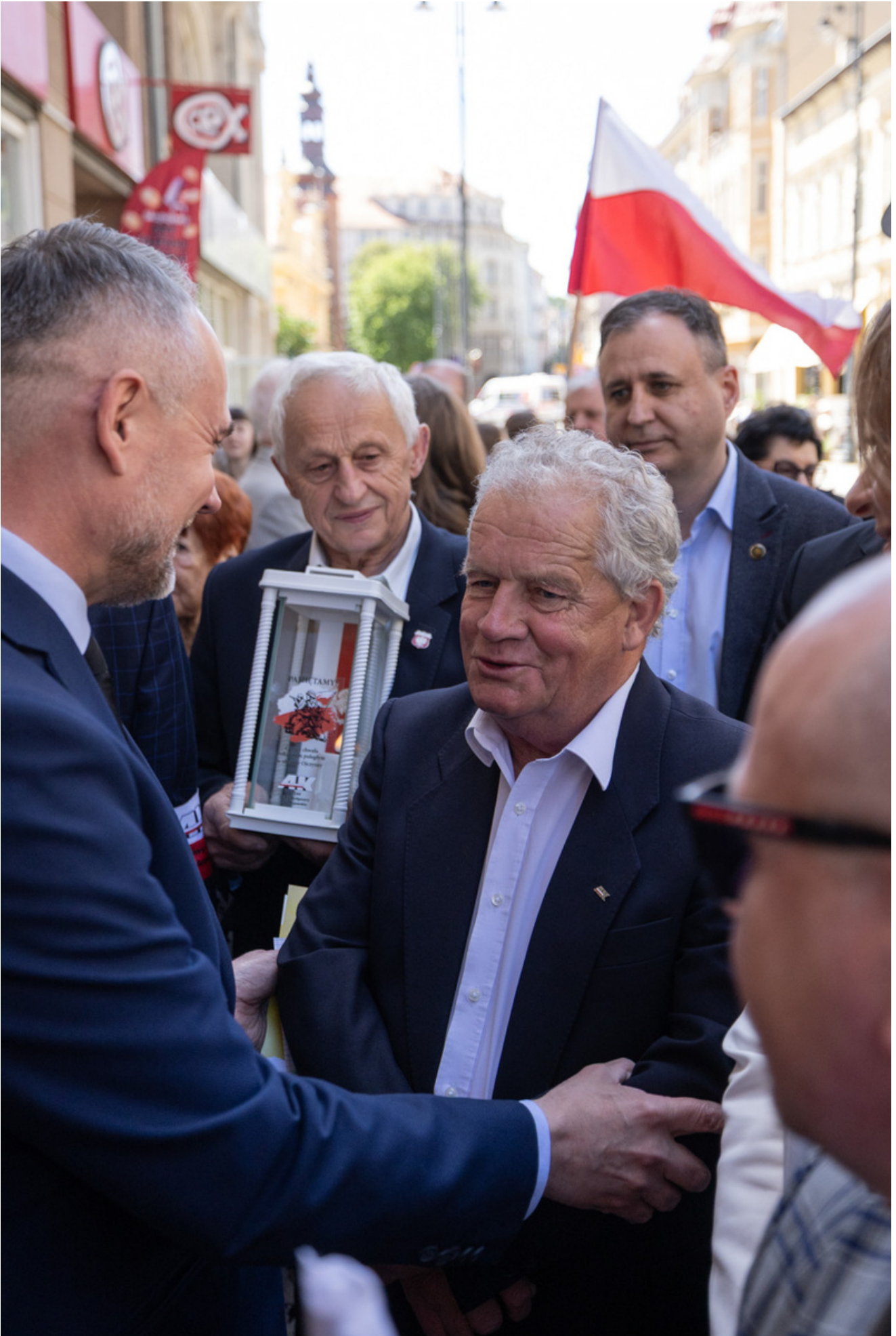
W dniu 29 maja 2026 r. w Bydgoszczy odbyły się uroczystości upamiętniające 80. rocznicę śmierci Jerzego Gadzinowskiego