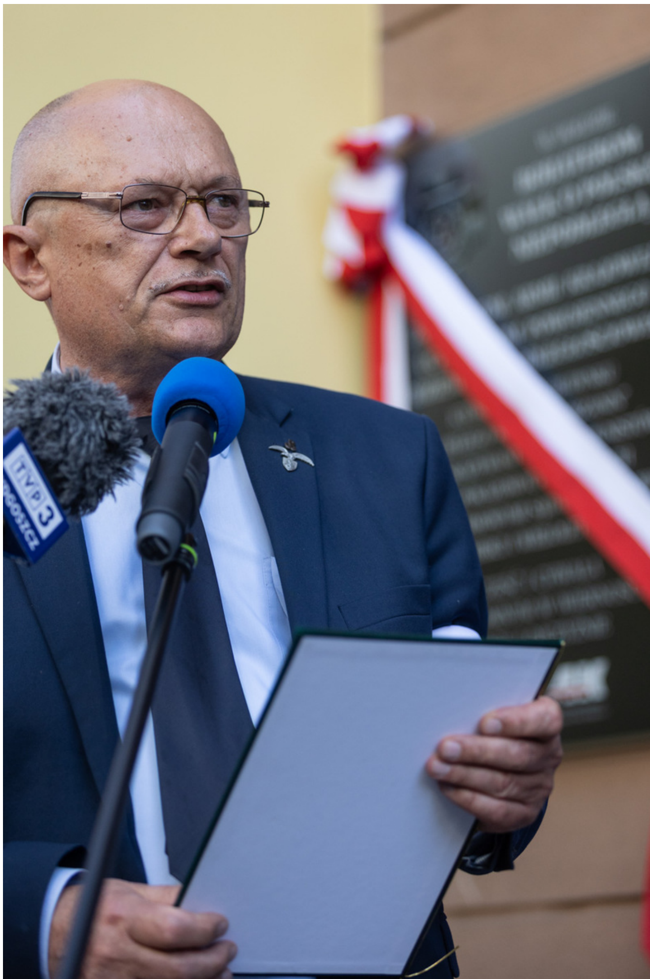
W dniu 29 maja 2026 r. w Bydgoszczy odbyły się uroczystości upamiętniające 80. rocznicę śmierci Jerzego Gadzinowskiego