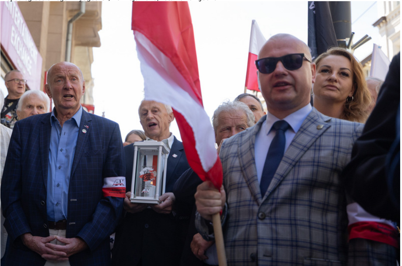
t 29 maja 2026 r. w Bydgoszczy odbyły się uroczystości upamiętniające 80. rocznicę śmierci Jerzego Gadinowskiego „Szarego” oraz jego sześciu podkomendnych - żołnierzy Armii Krajowej i uczestników powojennego podziemia niepodległościowego - Bydgoszcz, 29 maja 2026, fot. Roman Jocher