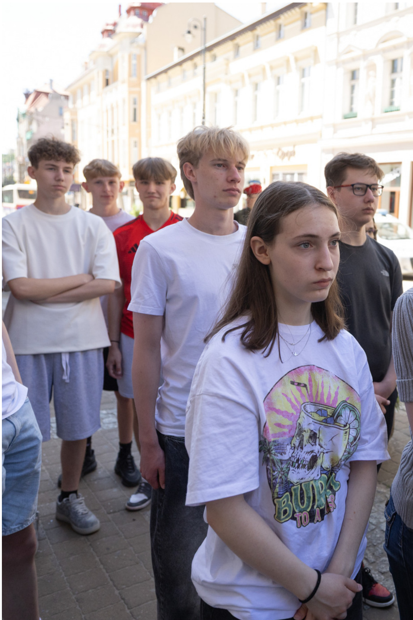
t 29 maja 2026 r. w Bydgoszczy odbyły się uroczystości upamiętniające 80. rocznicę śmierci Jerzego Gądzinowskiego