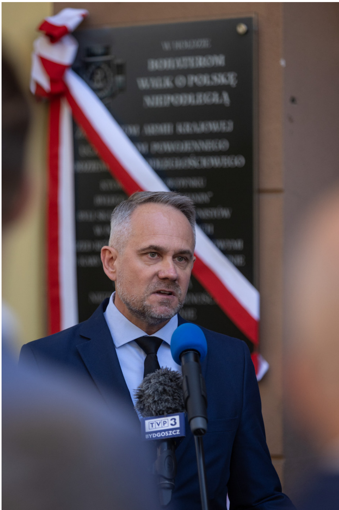
W dniu 29 maja 2026 r. w Bydgoszczy odbyły się uroczystości upamiętniające 80. rocznicę śmierci Jerzego Gadzinowskiego