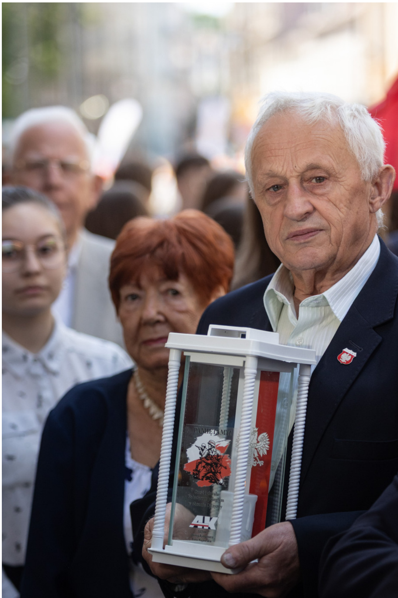
t 29 maja 2026 r. w Bydgoszczy odbyły się uroczystości upamiętniające 80. rocznicę śmierci Jerzego Gadzinowskiego