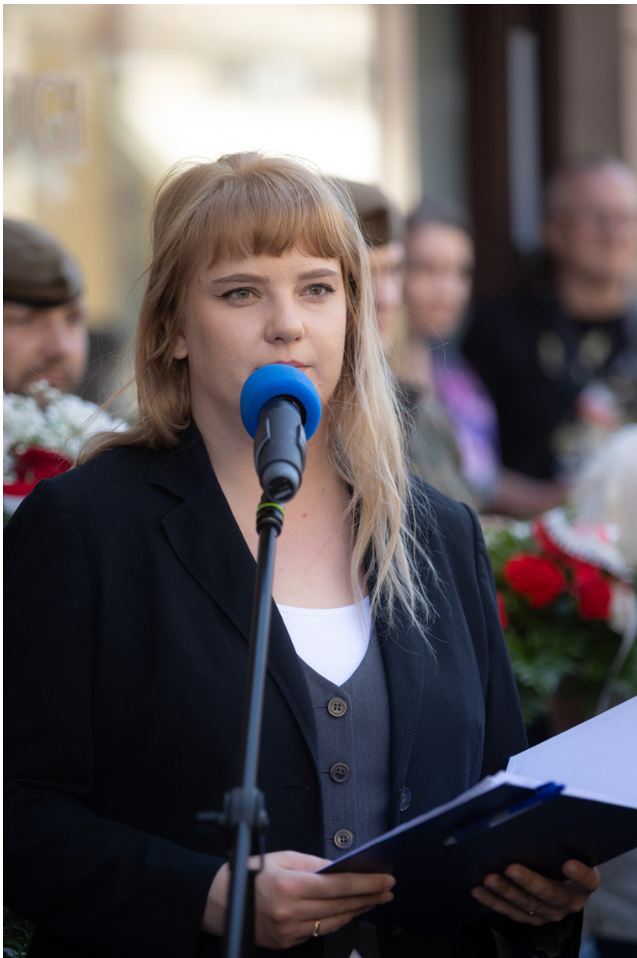
t 29 maja 2026 r. w Bydgoszczy odbyły się uroczystości upamiętniające 80. rocznicę śmierci Jerzego Gadzinowskiego