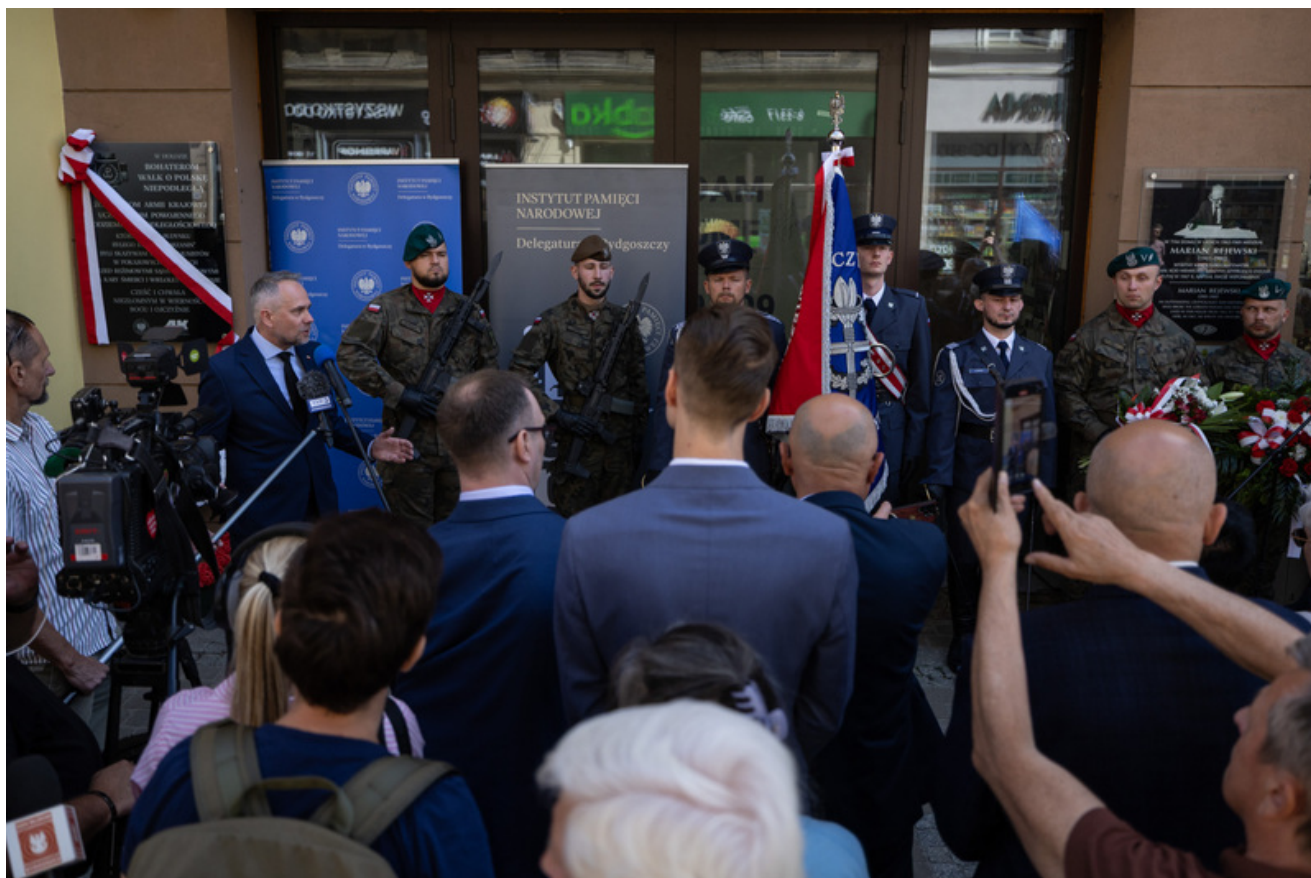
W dniu 29 maja 2026 r. w Bydgoszczy odbyły się uroczystości upamiętniające 80. rocznicę śmierci Jerzego Gadzinowskiego „Szarego” oraz jego sześciu podkomendnych – żołnierzy Armii Krajowej i uczestników powojennego podziemia niepodległościowego - Bydgoszcz, 29 maja 2026, fot. Roman Jocher