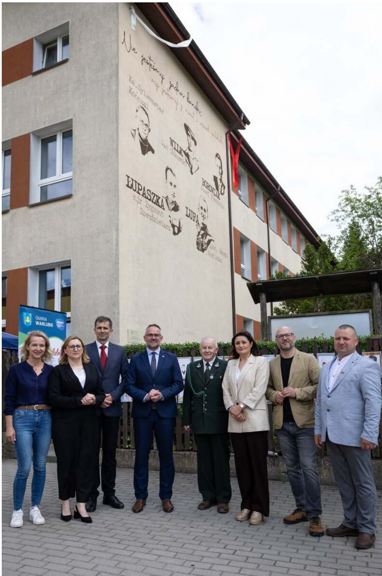
Bieg Pamięci w Lipinkach, 13 czerwca 2026