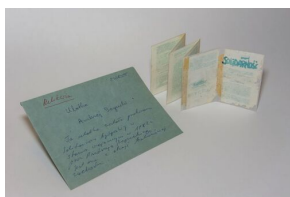
Ulotka, która w marcu 1982 r. trafiła w okolicy Bydgoszczy w ramach akcji balonowej zorganizowanej (IPN By 738/1)