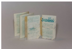
Ulotka, która w marcu 1982 r. trafiła w okolicy Bydgoszczy w ramach akcji balonowej zorganizowanej (IPN By 738/1)