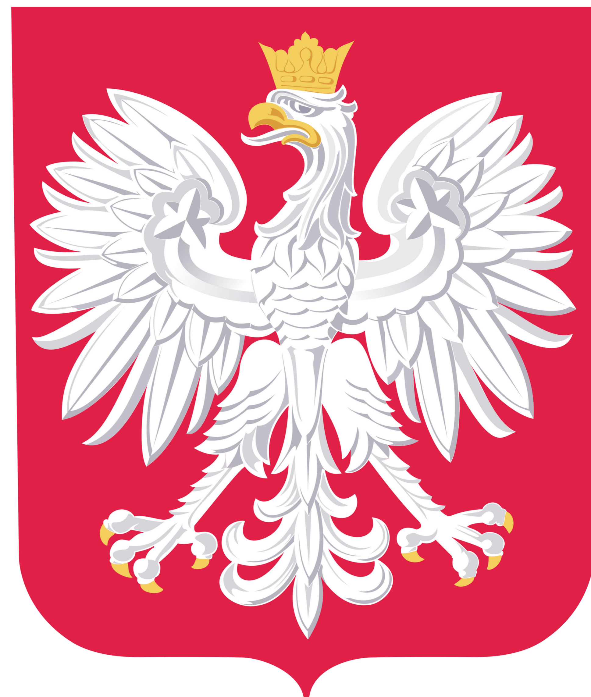
Godło Rzeczypospolitej Polskiej

Orzeł w koronie w tarczy stał się oficjalnym herbem państwa polskiego w XIII w., za panowania króla Przemysła II.