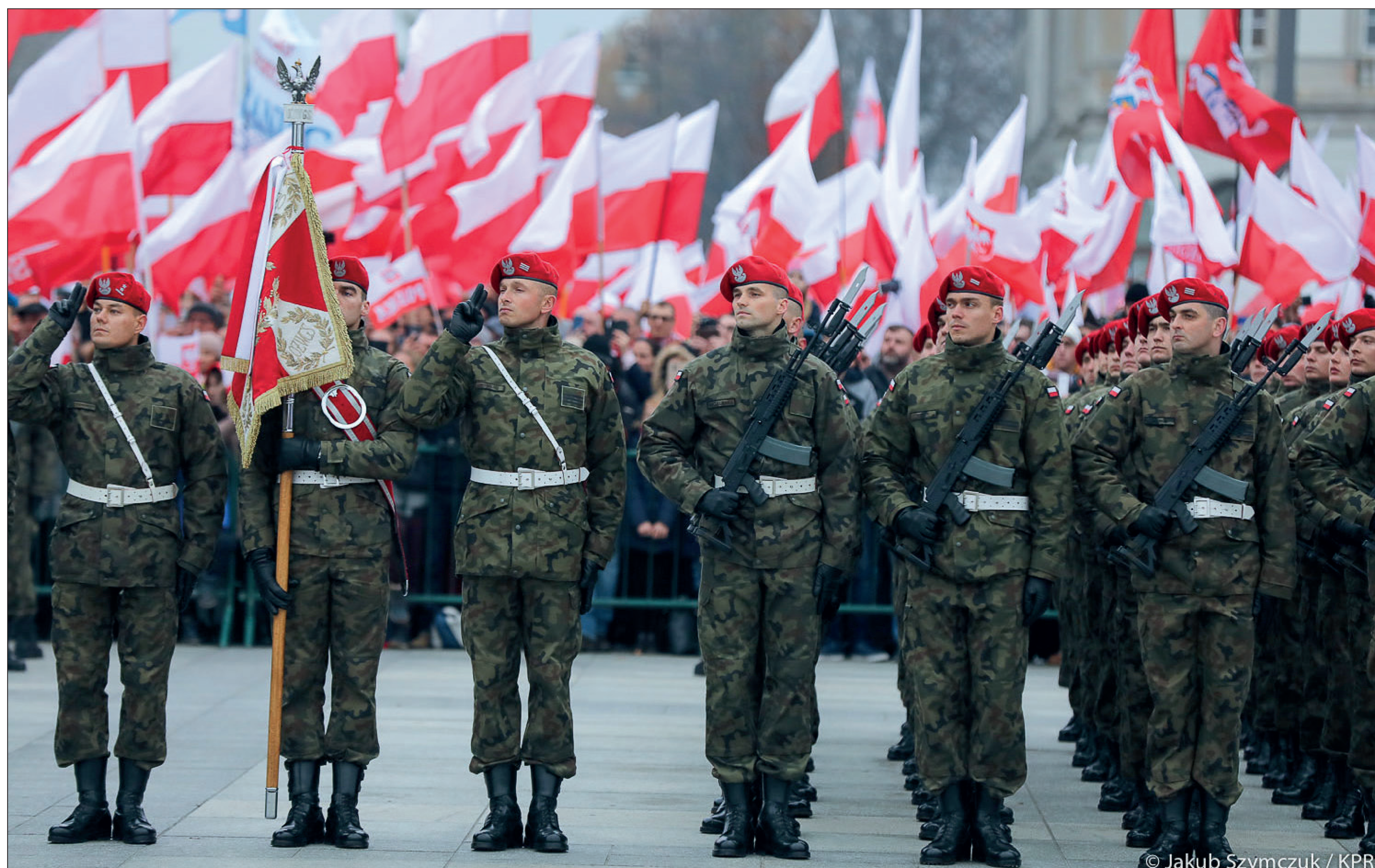
Święto Niepodległości 11 listopada, uroczysta odprawa wart przy Grobie Nieznanego Żołnierza, podniesienie flagi państwowej na maszt i odśpiewanie Hymnu RP

Opracowano na podstawie: Biało-czerwona , oprac. A. Znamierowski, Warszawa 2018 oraz Biało-czerwona i hymn polski , MSWiA 2018.