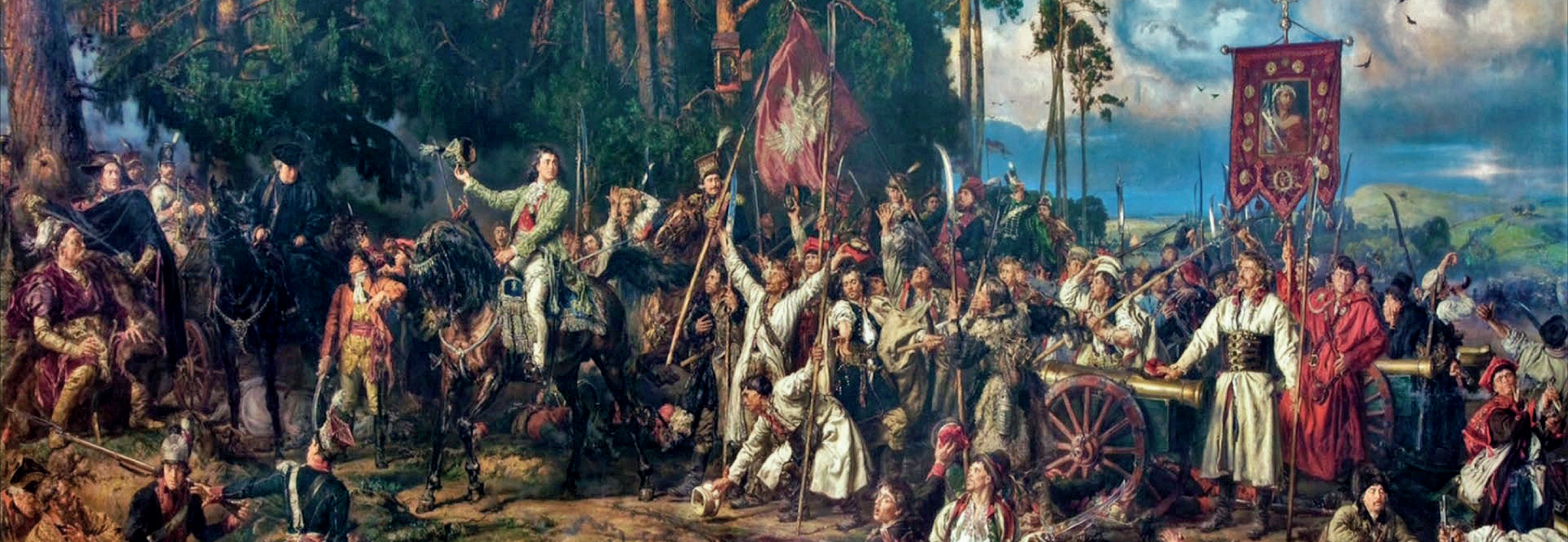
Jan Matejko, Kościuszko pod Racławicami, 1888

Symbolami narodowymi Rzeczypospolitej Polskiej są: godło – Orzeł Biały, barwy biało-czerwone oraz hymn – Mazurek Dąbrowskiego . Zapisy na temat symboli znajdują się w Konstytucji RP oraz Ustawie o godle, barwach i hymnie Rzeczypospolitej Polskiej oraz o pieczęciach państwowych.