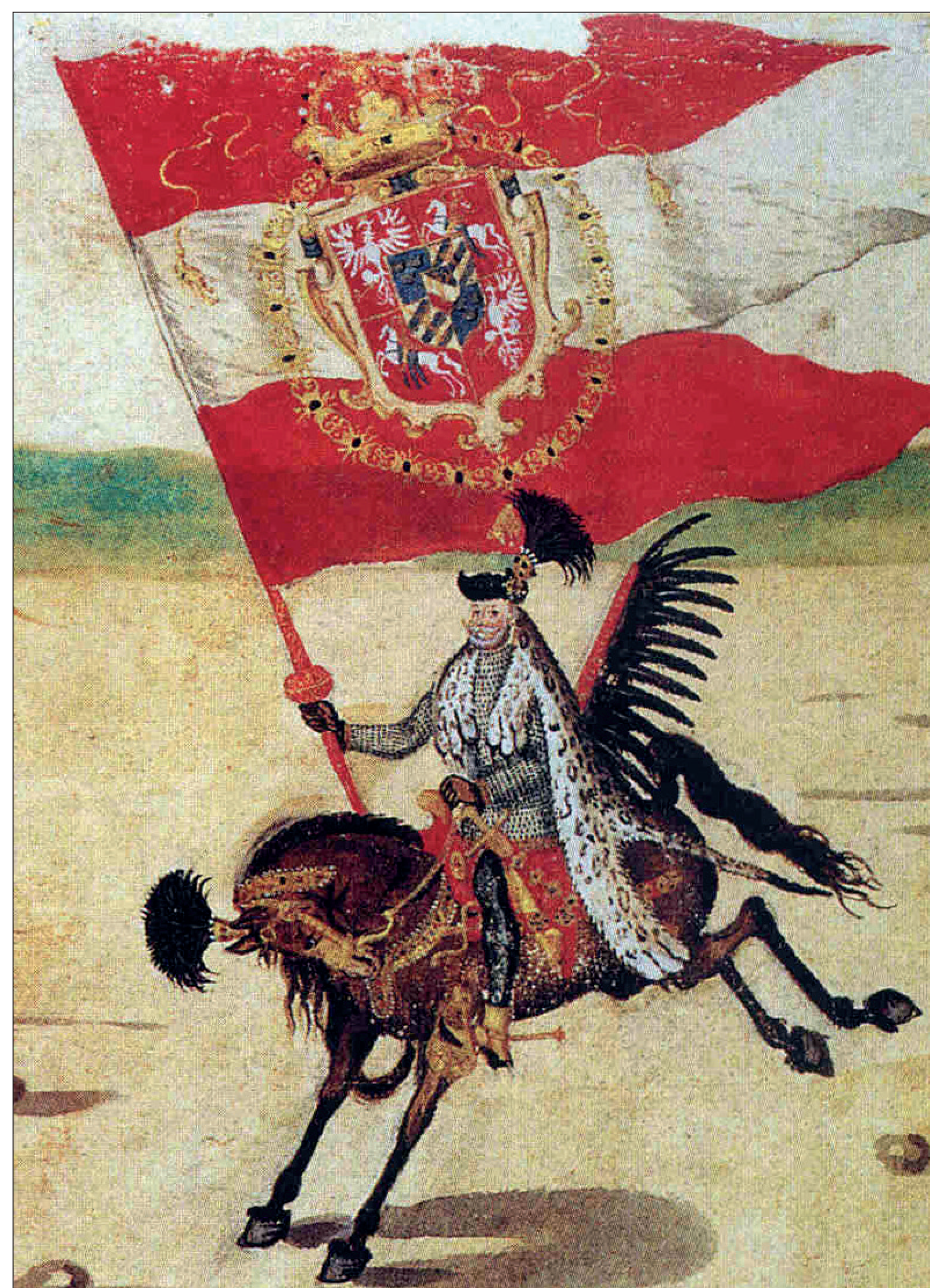
Chorąży z chorągwią króla Zygmunta III Wazy, fragment tzw. rolki sztokholmskiej, XVII w.

Warto podkreślić, że czerwień od najdawniejszych czasów była zarezerwowana dla władców, rycerzy i magnaterii – karmazynowe szaty jako synonim władzy, bogactwa i dostojności mogli nosić tylko ludzie uprzywilejowani. Biel była z kolei wykorzystywana w formie rozet na kapeluszach Wojska Polskiego w trakcie panowania Augusta II Mocnego. Kokardy (rozety) biało-czerwone pojawiły się za czasów Stanisława Augusta Poniatowskiego, ostatniego króla Polski.