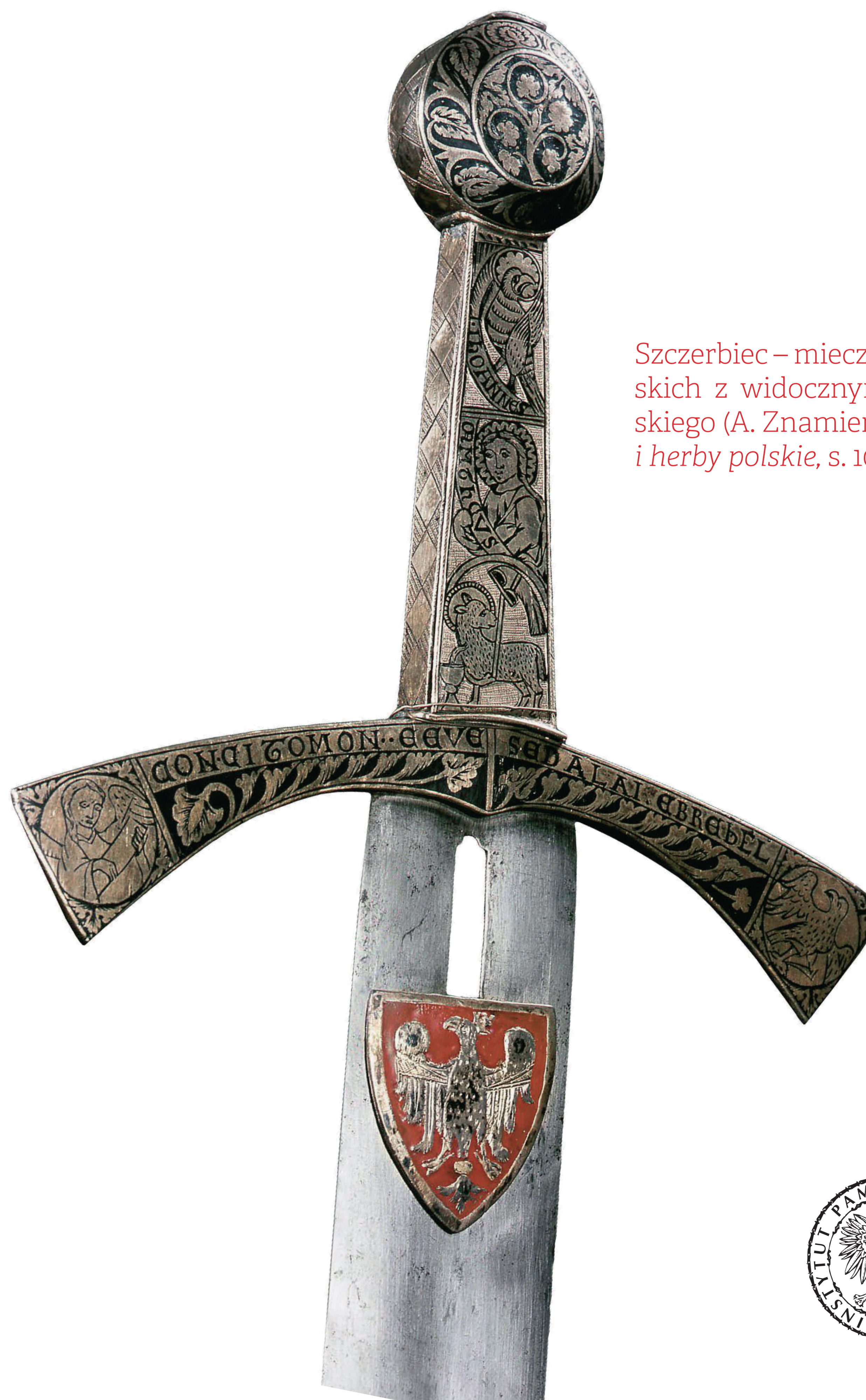
Szczerbiec – miecz koronacyjny królów polskich z widocznym herbem państwa polskiego (A. Znamierowski, Insignia, symbole i herby polskie , s. 10)