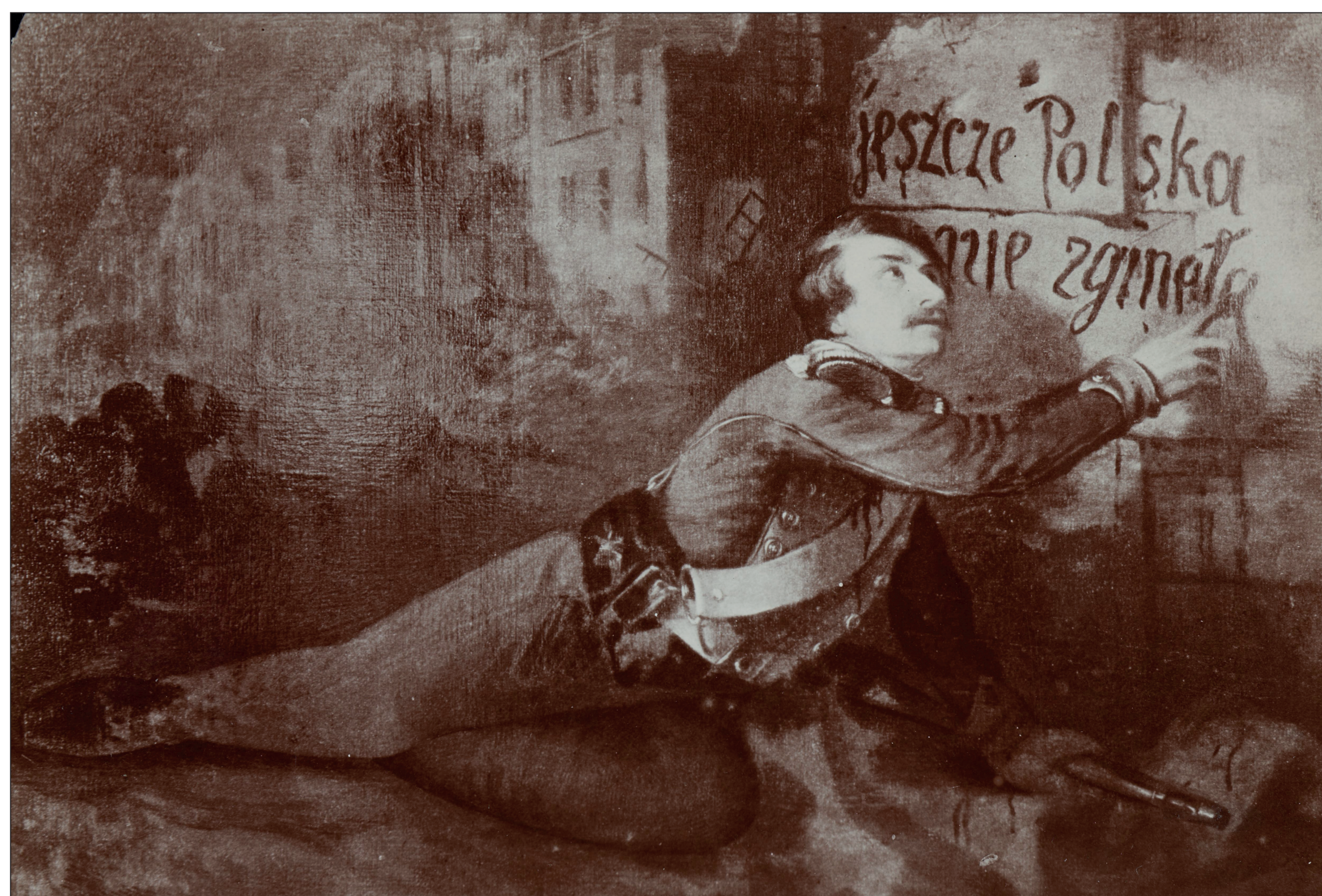
Charles Michel Guilbert d'Anelle, Varsovie. Épisode en 1831 („Umierający żołnierz wolności”), 1849 (domena publiczna)