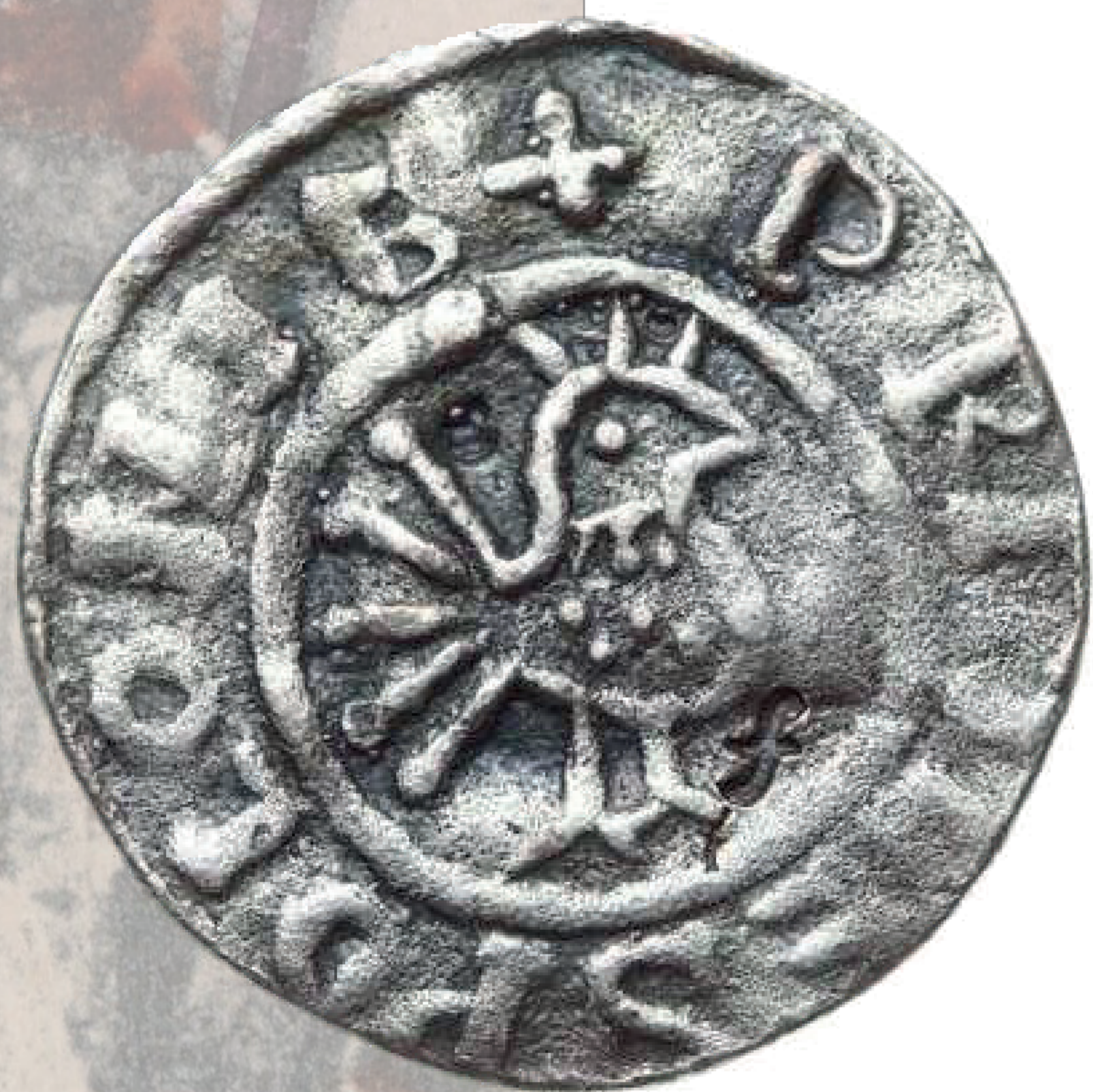
Denar Bolesława Chrobrego (A. Znamierowski, Insignia, symbole i herby polskie , s. 111)

Po raz pierwszy błędny zapis nazywający herb godłem pojawił się w stalinowskiej konstytucji z 1952 r. i został powielony w ustawie zasadniczej z 1997 r. Błąd w oficjalnym nazewnictwie spowodował rozdźwięk z zasadami heraldyki, dlatego też do dziś wzbudza dyskusje oraz głosy postulujące naprawę tego stanu.