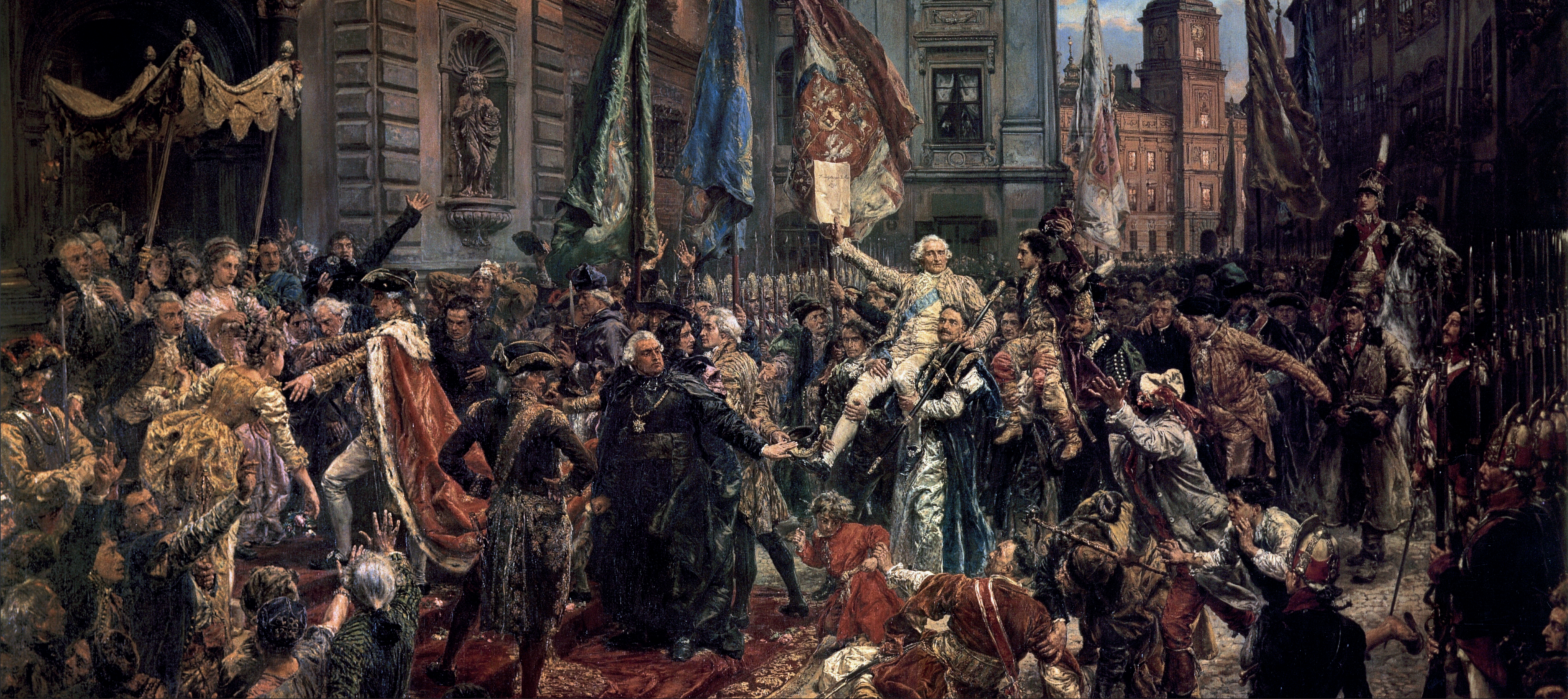
Jan Matejko, Konstytucja 3 Maja 1791 roku , 1891 (domena publiczna)